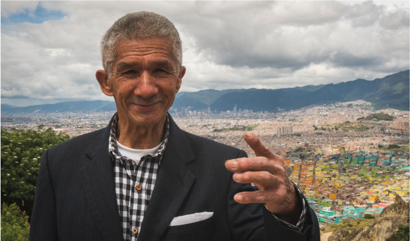
Juan Camilo Gonzalez/Santo Studio/AARP/HelpAge International - Colombia

Escuche lo que ellos tenían que decir en las siguientes páginas.