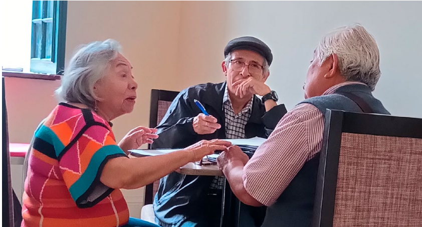
Asociación de Apoyo Auquis de Pamplona Alta – Perú

Queremos agradecer a la AARP por sus contribuciones y apoyo en el desarrollo del Módulo 5 de la Capacitación en pro de la Voz , además del Material complementario de aprendizaje y la audioguía