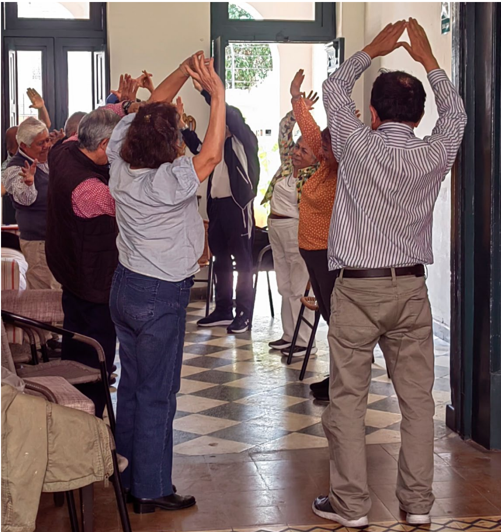
Asociación de Apoyo Auquis de Pamplona Alta – Perú