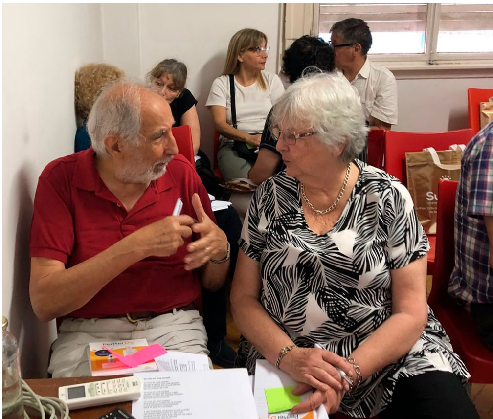
Sociedad Argentina de Gerontología y Geriatria – Argentina