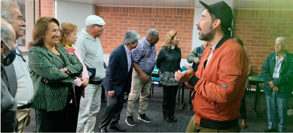
Asociación Red Colombiana de Envejecimiento – Colombia