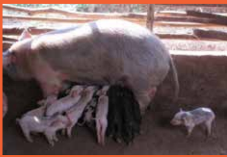
बंगुर आफ्ना १० वटा बच्चालाई दूध खुवाउँदै

ज्येष्ठ नागरिक समूहमा आबद्ध हुनु भन्दा पहिला बुढेसकालको बारेमा निकै चिन्ता लाग्थ्यो जब यस समूहमा आबद्ध भए पश्चात आफुले धेरै कुरा थाहा पाएको र बुढेसकालमा सकृय जीवन यापनका लागि उर्जा मिलेकाले बुढेसकाल भनेको सुतेर मात्रै विताउनु नपर्ने रहेछ । प्रत्यक्ष वा अप्रत्यक्ष रुपमा भए पनि केही गर्न सकिदो रहेछ भनेर म आजकल आफ्ना छरछिमेकी र आफन्तलाई पनि सम्झाउन सक्ने भएको छु । यस्ता कार्यक्रमले गर्दा निर्णय प्रक्रियामा ज्येष्ठ नागरिकको भुमिका महत्पूर्ण हुने रहेछ भन्ने थाहा पाउनुका साथै स्थानीय निकायमा रहेको लक्षित बजेटबाट पनि हामीले आफ्नो आयआर्जन र क्षमता अभिवृद्धिको काम पनि गर्न सकिदो रहेछ भन्ने कुराको पनि जानकारी पाईयो ।