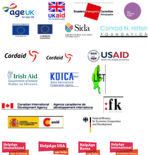
Sarah Marzouk/HelpAge International

Fundación AARP; Age UK; AusAID; AWO International; Big Lottery Fund (BIG); Agencia Canadiense para el Desarrollo Internacional (ACDI); Fundación Conrad N. Hilton; Cordaid; Comité de Emergencias y Desastres (DEC, por sus siglas en inglés) vía Age UK; Departamento de Ayuda Humanitaria de la Comisión Europea (ECHO, por sus siglas en inglés); Unión Europea (UE); Ministerio Federal de Cooperación Económica y Desarrollo (BMZ, por sus siglas en alemán); FK Norway; Guernsey Overseas Aid Commission; HelpAge Alemania; HelpAge International España; HelpAge Corea; HelpAge USA; Irish Aid; Jersey Overseas Aid Commission; Die Johanniter/Johanniter-Auslandshilfe; Fundación de Caridad Kadoorie; Agencia de Cooperación Internacional de Corea (KOICA por sus siglas en inglés); Fondos Fiduciarios para Medios de Vida y Seguridad Alimentaria (LIFT, por sus siglas en inglés); Neupostolische Kirche-karitativ; Agencia Española de Cooperación Internacional y Desarrollo (AECID); Agencia Sueca de Desarrollo Internacional (ASDI); Departamento para el Desarrollo Internacional de Reino Unido (UK aid); UNDP; UNFPA; UNHCR; UNICEF; UNOPS; USAID; WorldGranny.