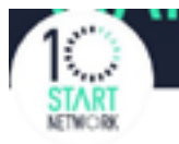
Start Network @StartNetwork (3 sigas)