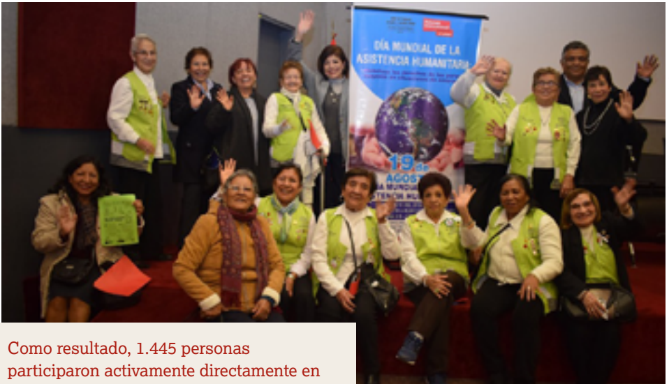
Mesa de Trabajo de ONGs y Afines sobre las Personas Adultas Mayores

La Asociación Cultural Casa del Niño, en Colombia; la Fundación NTD, en República Dominicana; la Mesa de Trabajo de ONGs y Afines sobre las Personas Adultas Mayores, en Perú; Haitian Society for the Blind, en Haití; Haiti Vision, Haití; la Red Subregional del Sur, en Argentina y la Red Andina de Personas Mayores, en Colombia, Venezuela y Bolivia, hicieron un llamado para incluir a las personas mayores en las estrategias de gestión del riesgo de desastres.