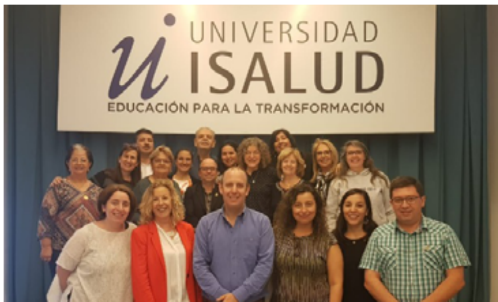
Red Subregional Sur

desarrollada por la Fundación Commonwealth. Un interesante espacio que promovió la construcción de conocimientos para incorporar las nuevas pautas de trabajo en red.