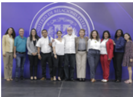
Red Subregional Centroamericana y del Caribe Envejecer con Dignidad

Con nuestro apoyo técnico y financiero, se llevó a cabo el tercer encuentro de la Red Subregional Centroamericana y del Caribe Envejecer con Dignidad , en República Dominicana. Este encuentro proporcionó un espacio propicio de incidencia para discutir en el Ministerio de Relaciones Exteriores sobre la importancia de ratificar la Convención Interamericana sobre la Protección de Derechos Humanos de las Personas Mayores.