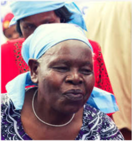
Mohamed Altoum/HelpAge International