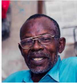
Joseph Jr-Fitzley/HelpAge International