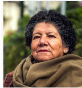
Sebastian Ormaches/HelpAge International