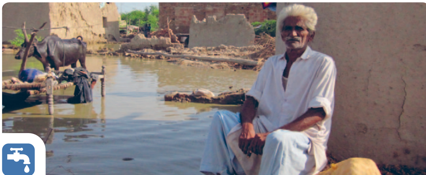
Lucy Bloun/HelpAge International