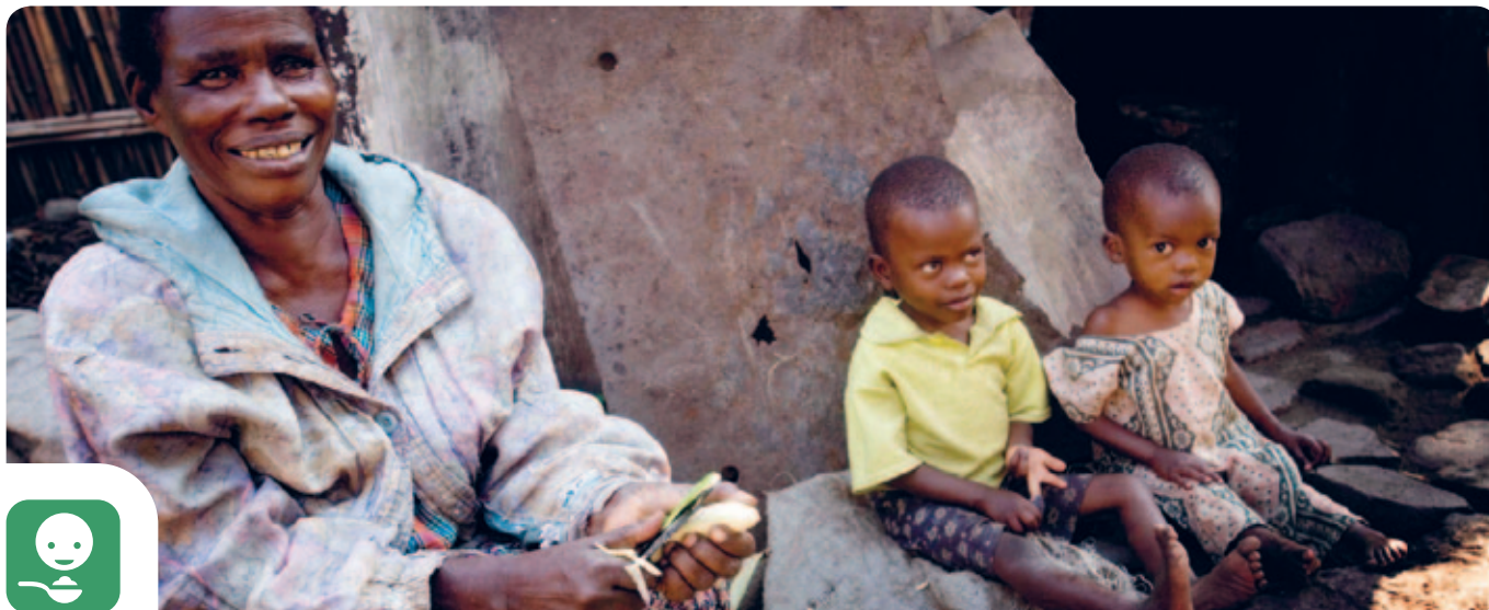
Kate Holt/HelpAge International