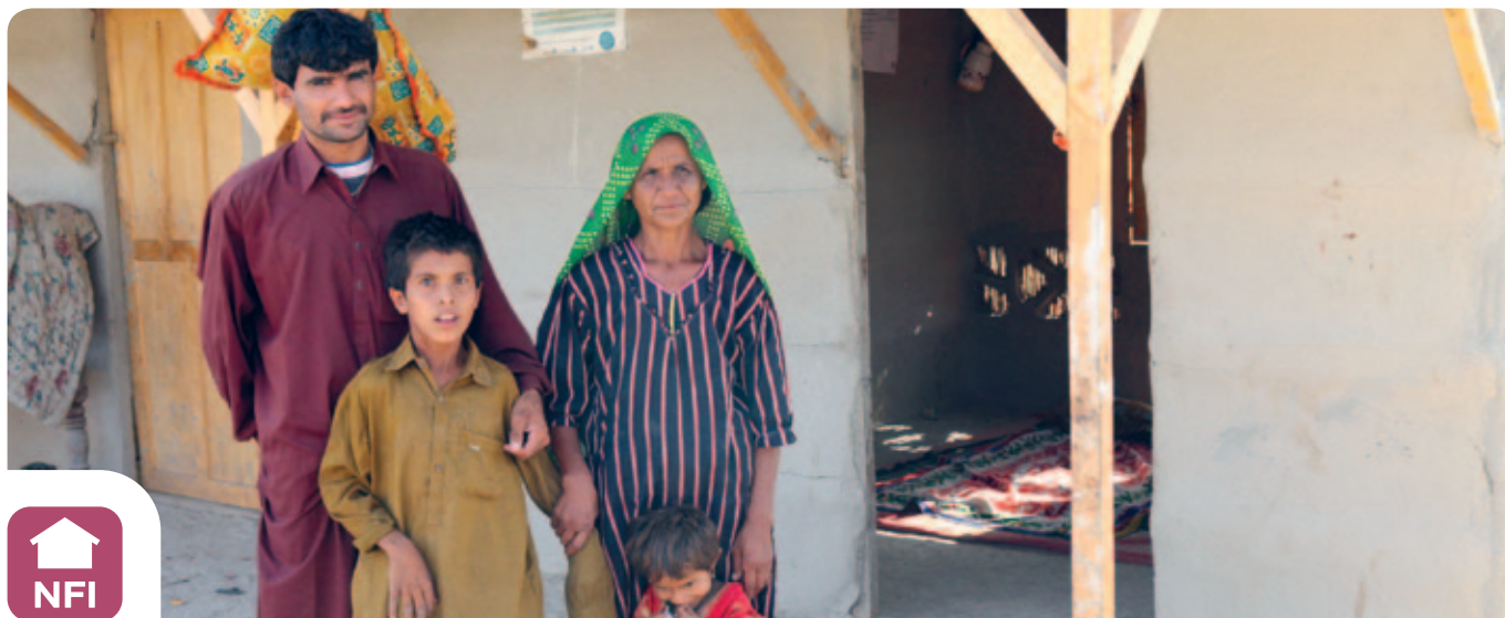
Brice Blonde/Handicap International