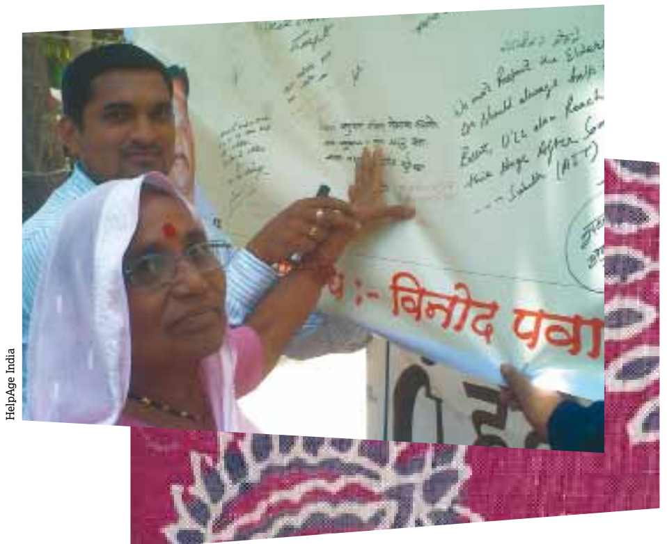
Una mujer mayor firma apoyando “Di No al Abuso de Personas Mayores” en Vishrantwadi, Pune.