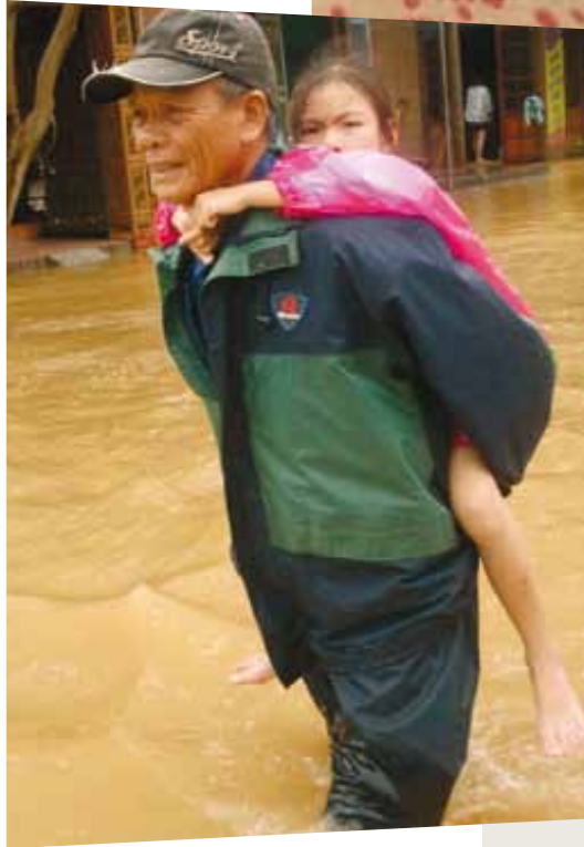
Vietnam Women's Union

Utilice citas e historias. Una cita bien elaborada puede lograr el mismo efecto que las cifras. El coordinador de alivio de la ONU Jan Egeland dio a reporteros algo sobre lo cual escribir en marzo de 2005 cuando dijo que la cantidad de muertos en la República Democrática del Congo en los últimos seis años equivalía a "un tsunami cada seis meses". Las citas y las historias de personas mayores