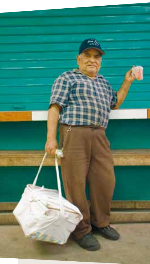
Antonio Olmos/HelpAge International

En Nigeria menos del 8 por ciento de las mujeres sobre los 60 años puede acceder a préstamos bancarios, micro-créditos o cooperativas, comparado con el 39 por ciento de las mujeres entre 30 y 40 años. (22)