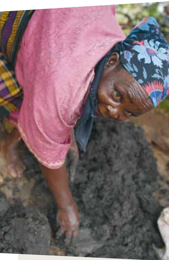
Kate Holt/HelpAge International