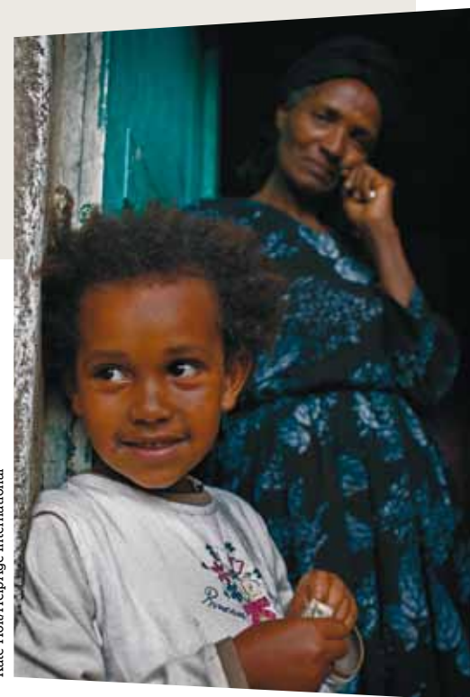
Kate Holt/HelpAge International