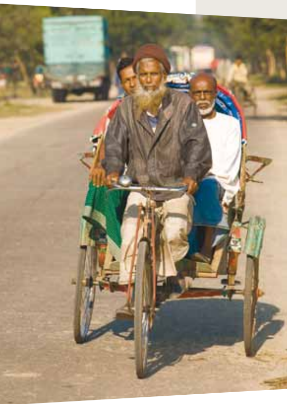
Antonio Olmos/HelpAge International