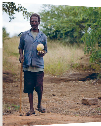
Kate Holt/HelpAge International