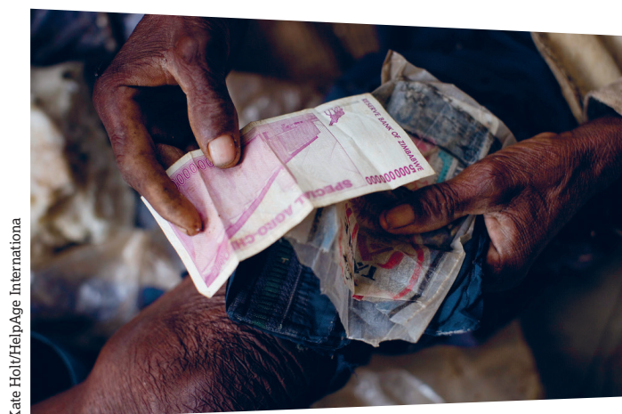
Kate Holiv/HelpAge International

Otro asunto que se debe considerar al incrementar los impuestos a las empresas es quién asume el costo. Esto puede dar lugar a que los accionistas (o todos los propietarios del capital) reciban menos utilidades, que los consumidores paguen precios más altos o que los trabajadores reciban sueldos más bajos, o una combinación de los tres elementos. 37 Por lo tanto es importante, al incrementar impuestos a las empresas, considerar a quiénes transfieren las empresas el peso del impuesto. También es importante tratar los temas de evasión de impuestos y de fraude de parte de empresas. Los gobiernos deben implementar medidas para mitigar estos dos riesgos.