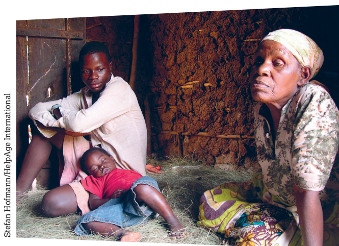
Stefan Hofmann/HelpAge International