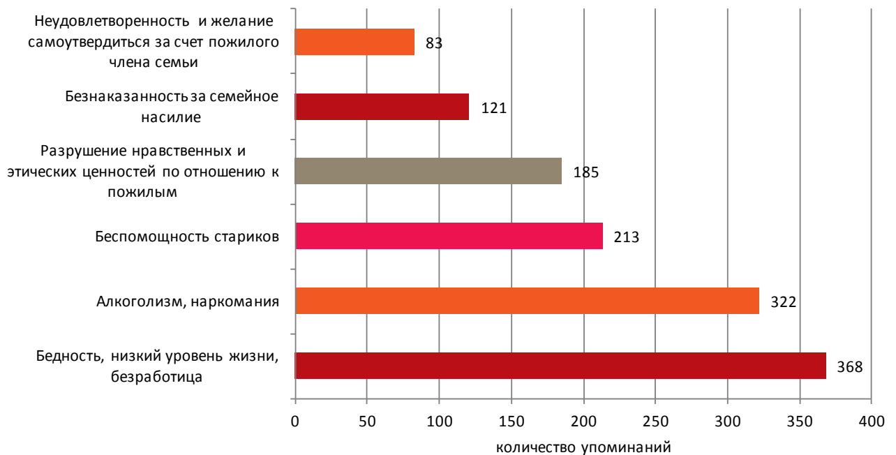
Рис. 3. Причины семейного насилия в отношении пожилых людей (по данным опроса, проводимого во время исследования). 10

Участники опроса также поделились мнением о виновных в совершении насилия в отношении пожилых людей. Каждый третий участник исследования (33%) считает, что насилие в семье в отношении пожилых людей чаще всего совершают снохи. Почти столько же респондентов (30%) полагают, что насилие в отношении пожилых в семье исходит от детей. Это, возможно, связано с традицией, согласно которой женщины живут в семье мужа, с пожилыми родителями также часто живут их взрослые неженатые дети. Считается, что они должны заботиться о старых родителях. В то же время анализ фокус-групповых дискуссий и глубинных интервью показывает, что в обществе широко распространено мнение, что ухаживать за стариками должны снохи, тогда как с сына снимается всякая ответственность.