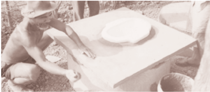
Construyendo un retrete cerca de la vivienda de una persona mayor.

Personas mayores de Camboya idearon una solución práctica para el problema de la falta de higiene en sus comunidades.