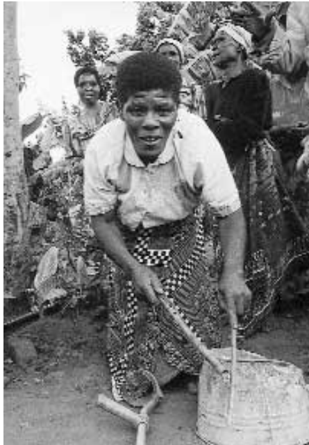
John Cobb/HelpAge International

Facultar a las personas mayores con discapacidad para participar en la sociedad significa eliminar las barreras tanto ambientales como sociales.