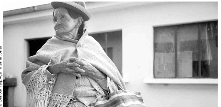
Un informe de la OPS se enfoca en el envejecimiento y la salud en América Latina

Envejeciendo con Dignidad - Nuevos Retos - Nuevas Posibilidades - Nuevas Soluciones 12 Congreso de la Asociación Internacional de Psicogeriatría 2005, Stocolmo, Suecia Los simposios incluyeron 'Retos de la Investigación sobre Envejecimiento en países de bajos ingresos'