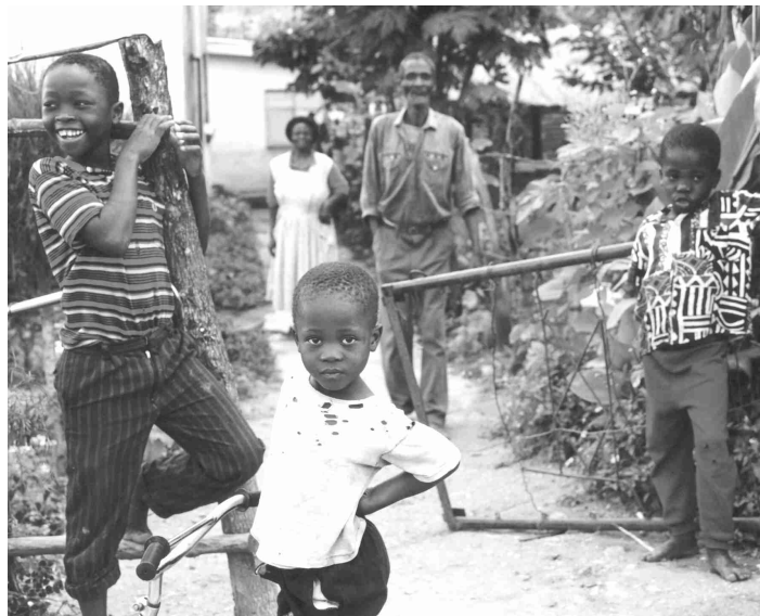
La pobreza crónica afecta a los ancianos y a los niños en particular.

Se ha pedido a los donantes que apoyen el programa NEPAD de la Unión Africana para desarrollar un marco de derechos e inclusión, y a apoyar para que los países desarrollen estrategias de protección social. Los comisionados piden un financiamiento a largo plazo y predecible para financiar la protección social, con asignación de US$2 mil millones a disponerse inmediatamente, elevándose de US$6 a 6