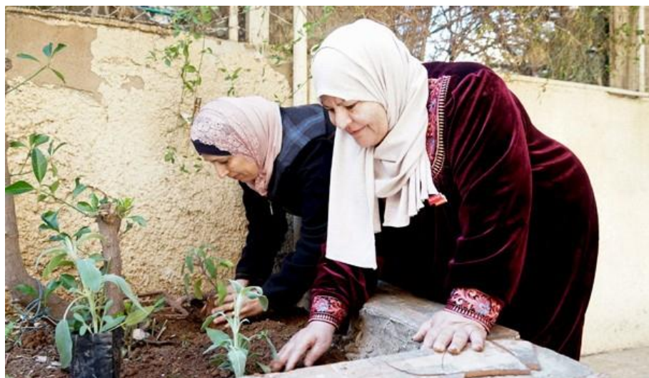
Fedaa Qatatsah/HelpAge Jordan