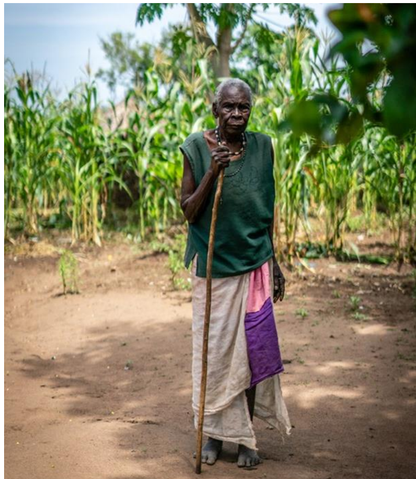
Ben Small/HelpAge International

A menudo son las asociaciones de personas mayores quienes se encargan de elevar las voces de las personas mayores. En aquellos lugares las comunidades comparten con quienes consideran líderes respetados y custodios del conocimiento local histórico y las prácticas tradicionales y sostenibles. De allí surgen las historias que narramos a continuación. Relatos que evidencian la manera en que es posible que las voces de las personas mayores tengan fuerza y sean poderosas al momento de exigir cambios y de apoyar las actividades de mitigación y adaptación al cambio climático.