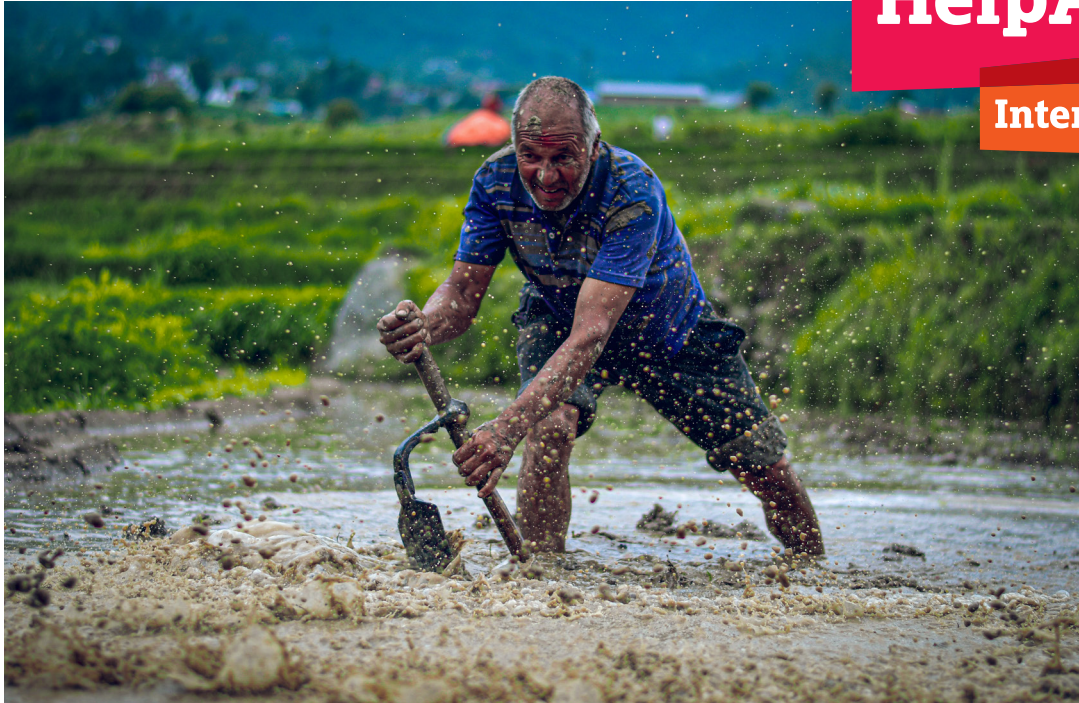
Ganesh Bista/Ageing Nepal