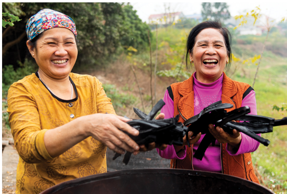
Le Minh Duc/HelpAge Vietnam

Как активные члены своих сообществ, уважаемые лидеры и носители традиционных и исторических знаний, многие пожилые люди играют активную роль в захватывающих и новаторских мероприятиях по смягчению последствий изменения климата и адаптации к ним на уровне сообществ.