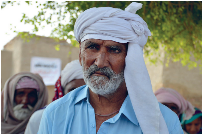
Oscar Franklin/Age International