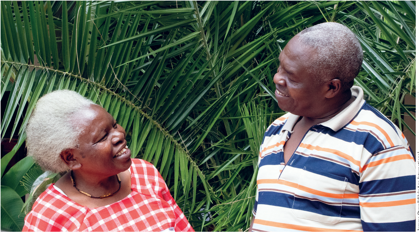
Jemma Stovell/HelpAge International

امرأة تبلغ من العمر 78 عاماً، متطوعة سابقة في مجال الصحة العامة تعيش مع زوجها في منطقة حضرية في جمهورية الدومينيكان