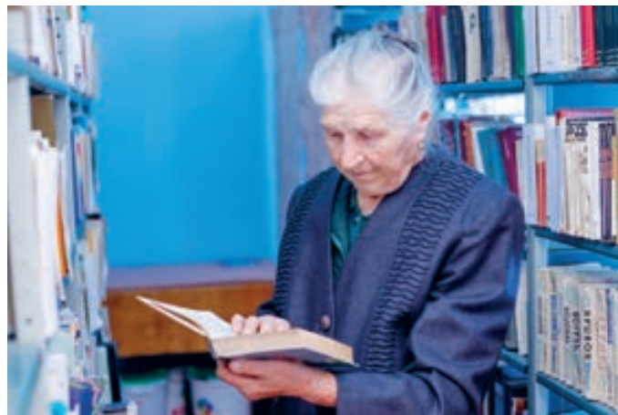
HelpAge International Moldova