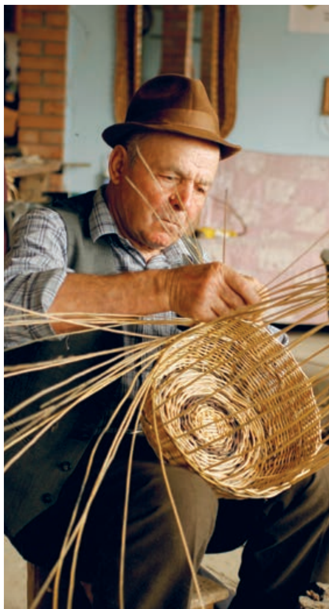
HelpAge International / Moldova