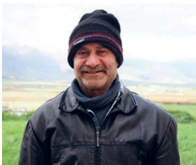
Fedaa Qatshsah/HelpAge International

A nivel regional, el derecho de las personas mayores a acceder a la justicia está consagrado en el Artículo 31 de la Convención Interamericana de Derechos Humanos de las Personas Mayores, y en el Artículo 4 del Protocolo a la Africana de Derechos Humanos y de los Pueblos sobre los derechos de las personas mayores en África.