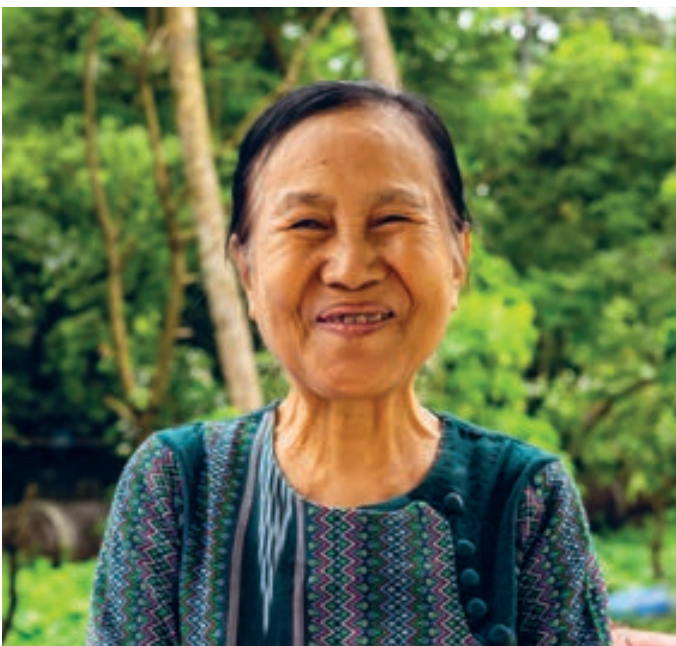
Ben Small/HelpAge International