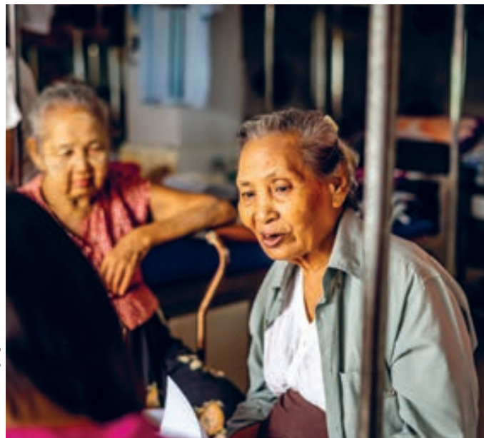
Ben Small/HelpAge International

Algunos participantes que no habían encontrado solución a su problema de justicia dijeron que su caso todavía estaba pendiente. Algunos pensaban que el caso tomaba demasiado tiempo.