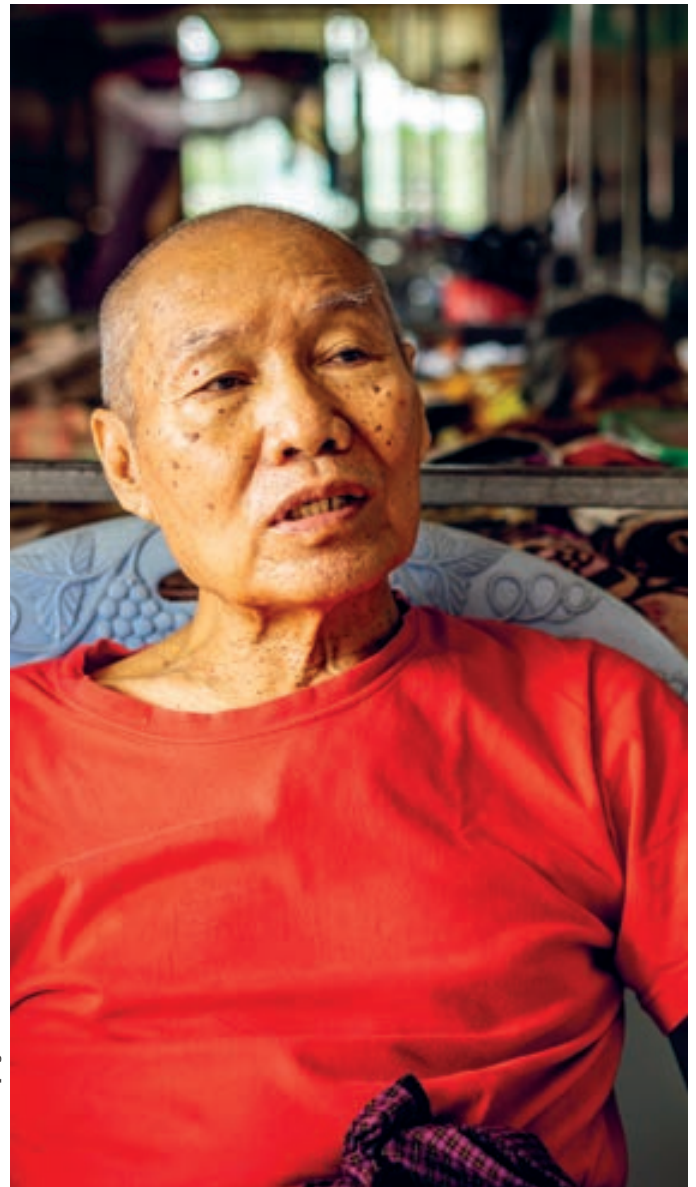
Ben Small/HelpAge International