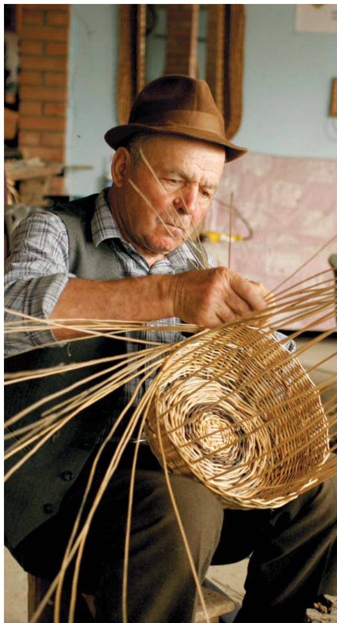
HelpAge International Moldova