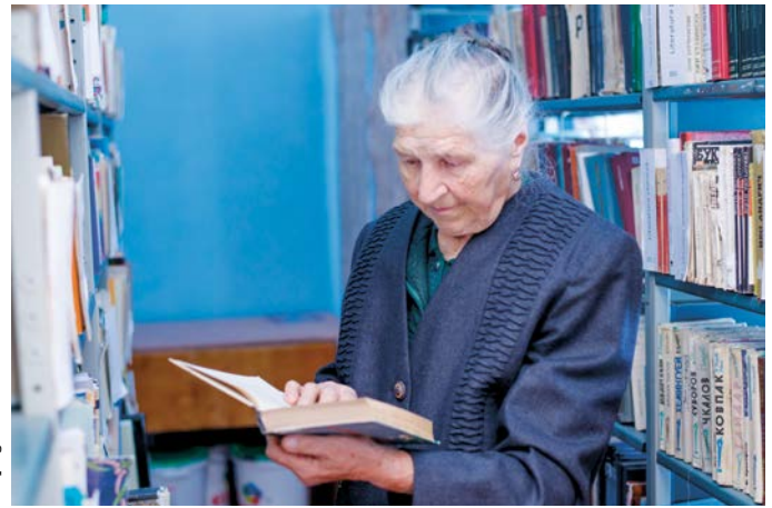
HelpAge International Moldova