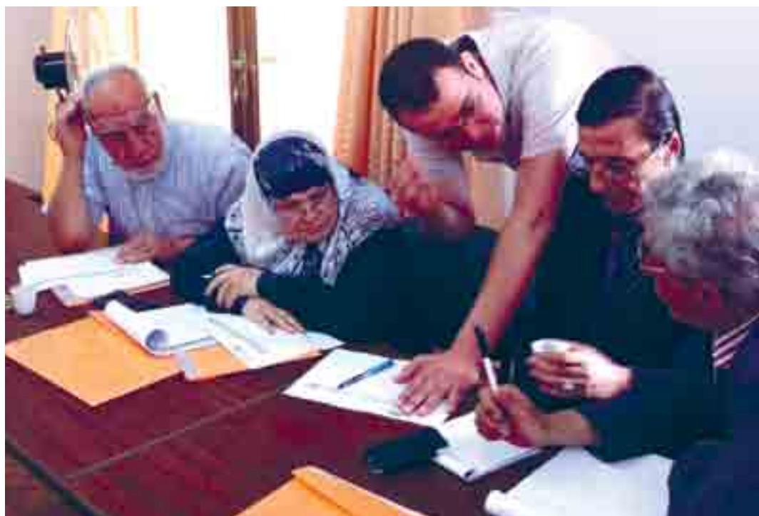
HelpAge International (occupied Palestinian territories)