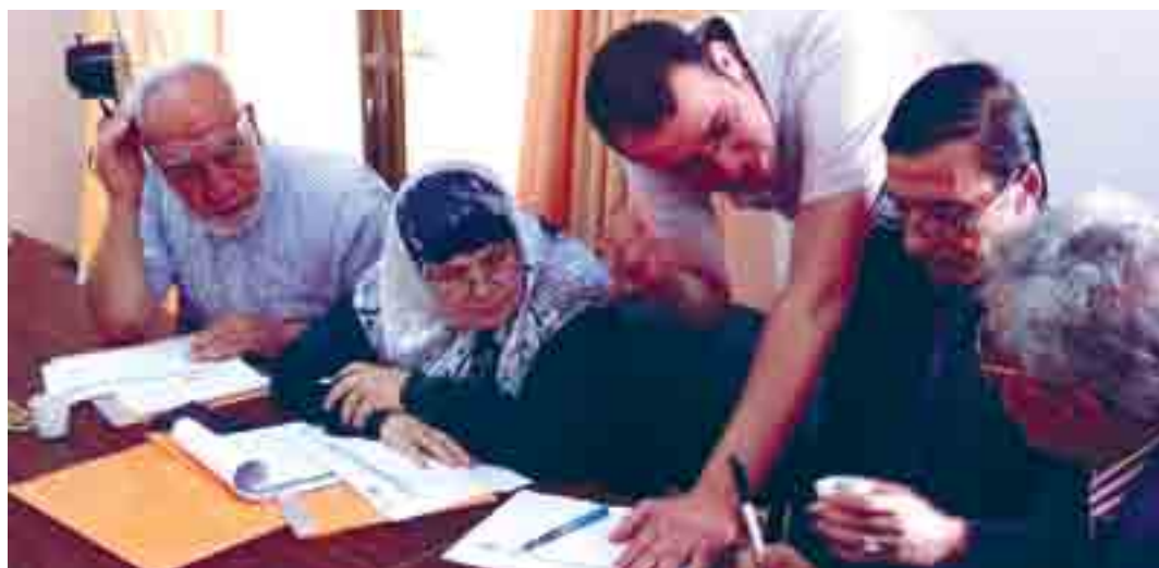
HelpAge International (occupied Palestinian territories)

Четвертый год: согласована новая политика; новая политика получила финансирование и запущена на реализацию; позитивные изменения в жизни людей.