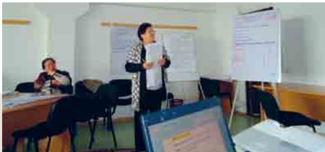
HelpAge International (Kyrgyzstan)

Крупномасштабное изменение очень редко бывает немедленным и его очень трудно добиться. По мере того, как вы ведете мониторинг деятельности и задач вашей кампании, мотивируйте себя перспективой многих потенциальных и обширных перемен. Чем больше у вас намерений на более широкие положительные переменные, тем более вероятно, что вы добьетесь результатов. Предложите участникам поразмыслить, какие могут быть потенциальные более широкие переменные кампании, направленной на защиту прав пожилых.