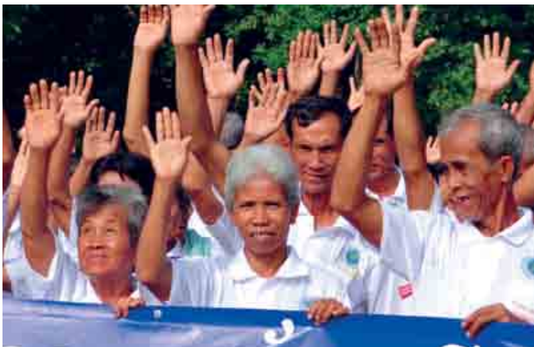
HelpAge International (Cambodia)

Заметка: Иногда решение проводить мониторинг своей деятельности бывает самой трудной частью мониторинга.