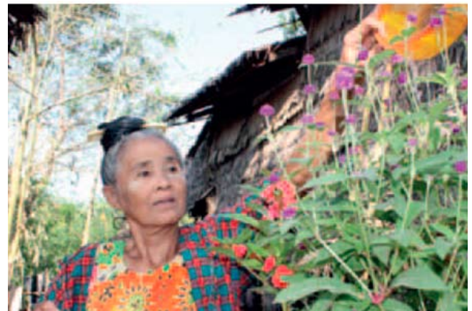
Cultivo de flores para la venta en Myanmar.

Mientras las pensiones, y particularmente las pensiones sociales, constituyen un importante fin en sí mismas, puesto que representan una enorme diferencia en el bienestar de las personas de edad, también se ha demostrado que benefician a familias