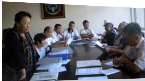
Участники тренинга обсуждают методы и подходы в решении проблемы семейного насилия над пожилыми. с. Чон-Сары-Ой, Иссык-Кульская область