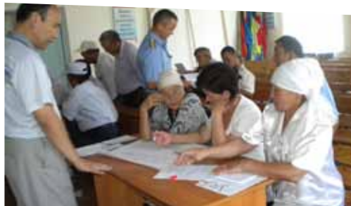
Тренинг для представителей МСУ и членов ГПЛ по насилию в семье в отношении пожилых. с. Каракочкор, Ошская область

Если Вы слышите в свой адрес обидные слова и оскорбления, запугивания, обвинения, то это психологическое насилие.