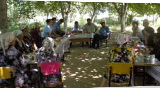
Представители МСУ и члены ГПЛ на тренинге по насилию в семье в отношении пожилых людей. с. Жаны-Дыйкан, Джалабадская область