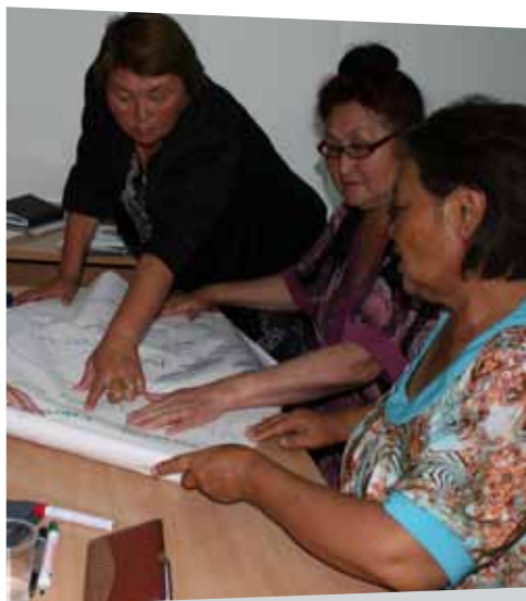
Тренинг для кризисных центров и ГПЛ «Осведомленность о вопросах старения» 24-26 мая, 2011 года, г. Бишкек

В настоящее время очень часто пожилые люди не рассматриваются государством, семьей как важные или ценные члены общества. Многие семьи рассматривают пожилых людей, как обузу. В обществе не созданы условия для вовлечения пожилых в активную жизнь. Изоляция пожилых людей в пределах дома является как причиной, так и следствием жестокого обращения. Многие пожилые изолированы еще из-за физических или психических недугов. Более того, потеря друзей и членов семьи снижает возможность социального взаимодействия.